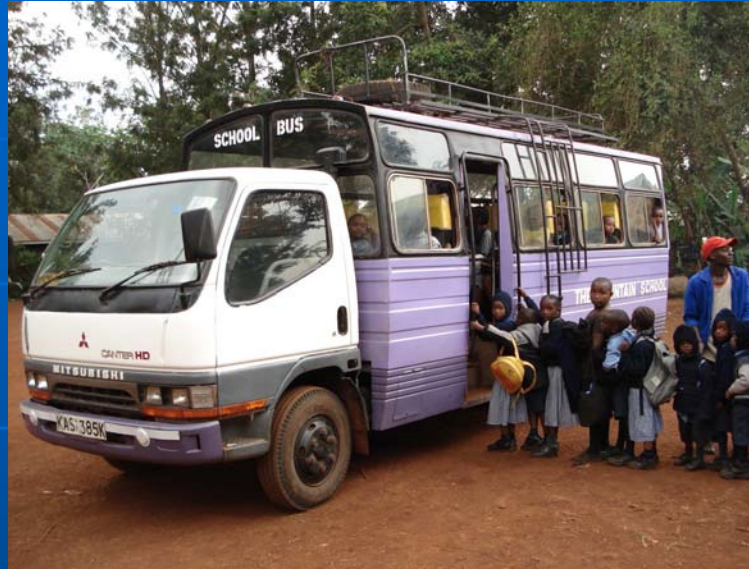
Der neue Schulbus

Im April 2007 konnte das Sonderprojekt „Schulbus“ dank der Unterstützung der Freunde der Fountain School mit dem Erwerb eines geeigneten Fahrzeuges abgeschlossen werden. Dieses ersetzte den alten Schulbus, dessen Reparatur aufgrund eines Motorschadens nicht mehr wirtschaftlich sinnvoll gewesen wäre.