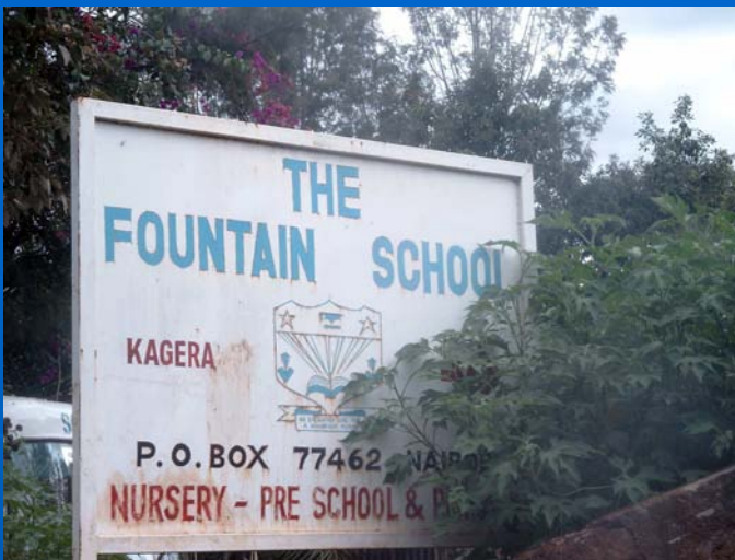
Schild an der Schuleinfahrt